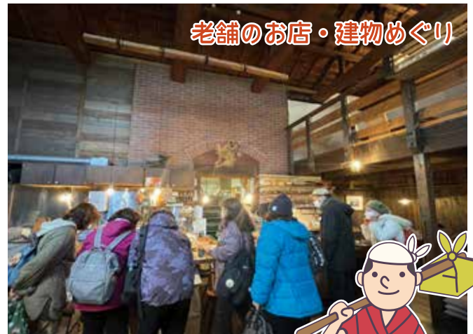
老舗のお店・建物めぐり