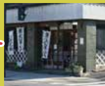
豊島屋本店 嘉永2年創業 和菓子の試食