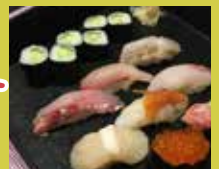
さつまや本店 和食寿司店 巻物の実演と昼食

主催：ふじさわ宿商店会・一般社団法人藤沢市商店会連合会・公益社団法人商連かながわ