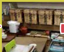
みつはし園茶舗 明治43年創業 お茶のおもてなし