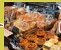
関次商店パンの蔵 風土 明治時代の蔵を改装 天然酵母のパン