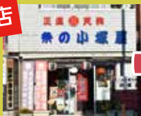
祭の小塚屋 明治38年創業 お祭り用品