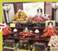
福田屋 明治20年創業 節句人形など