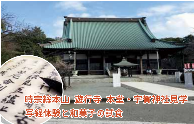
時宗総本山 遊行寺 本堂・宇賀神社見学 写経体験と和菓子の試食

商店街のツアー運営の参考になりますので、ほかの商店街の方もぜひご参加ご検討ください